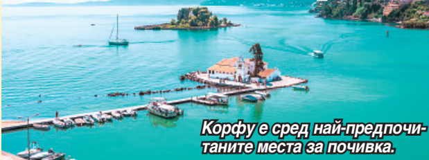
Корфу е сред най-предпочитаните места за почивка.

ни е една от най-популярните дестинации за почивка, е на първо място в класацията. Най-популярните дестинации са Атина, Крит и Корфу.